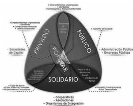
Figura 2. Sectores económicos en Ecuador