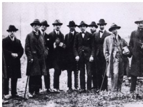
Fig. 1. (Dadaístas (1924) deambulación)

En esta época, las reflexiones de los poetas dadaístas apuntaban a negar la separación existente entre el artista y el producto estético; para ellos,