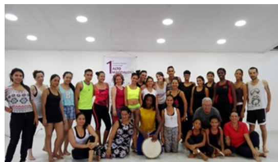
Taller Danza Afromandingue

escritoras Latinoamericanas. Para la cual hizo una investigación de biografías y textos y una convocatoria a las mujeres de la universidad para participar del homenaje. Las mujeres se reunieron en una de las plazas de la universidad, hicieron un recorrido por senderos, canchas, corredores y salones de clase con fotografías de las escrituras, realizando una lectura de poesía en movimiento. El rastro del recorrido quedó marcado con un camino de pétalos de rosas, y con el rojo de las fresas que las mujeres participantes mordían y compartían con las personas sorprendidas por el evento.