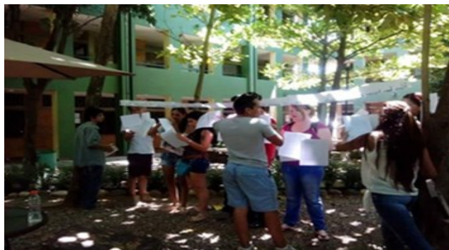
Instalación de textos Literatura erótica en la plaza de la universidad

espacios físicos de la universidad, en los lugares más transitados de la ciudad y en las redes sociales.