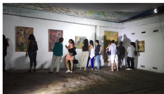
Exposición de pintura