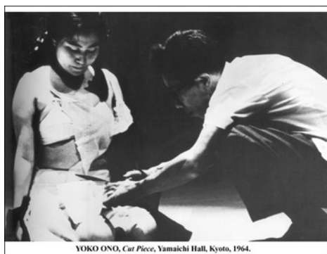
Fig. 2. Cut piece [performance]

Son necesarios los cuerpos, los lugares, el tiempo y los movimientos para que la vida se mantenga. El cuerpo necesita de tiempo, lugar y movimiento para vivir. Para que la escritura sea posible es necesario el cuerpo del escritor, uno o varios tiempos, un lugar donde su escritura se construya, también necesita movimiento para que su mano se desplace sobre la hoja o el teclado; hay movimiento entre los personajes que crea, entre las ideas que construye.