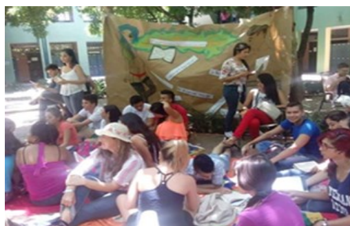
Sala de lectura: Literatura erótica

F.A.Q. Letras semillero: estrategias de seducción