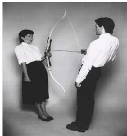
Fig. 3. (Abramovic (1980)Rest Energy [Performance])

Dentro de las características del performance están su carácter efímero y ritual. El desplazamiento sobre los lugares y el uso que se hace de los objetos es profundamente simbólico. Igualmente, la carga ideológica y emocional del artista, se manifiesta a través de las acciones y las reacciones de su cuerpo, en conjunción con las reacciones de los cuerpos de los espectadores. El conjunto de elementos de un performance son acciones que parten del sentir, pensar y actuar del artista y se manifiestan en su cuerpo presente y expuesto.