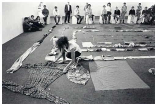
Fig.4. (Hincapié (1990) Una cosa es una cosa [performance])

El reto del semillero de investigación ha sido reunir la comunidad para alcanzar objetivos comunes: generar experiencias, intercambiar historias y saberes, reflexionar, construir oportunidades para aprender, transformarse en comunidad y al mismo tiempo transformar el contexto. Se ha tomado la propuesta del pedagogo Paulo Freire con la peda-